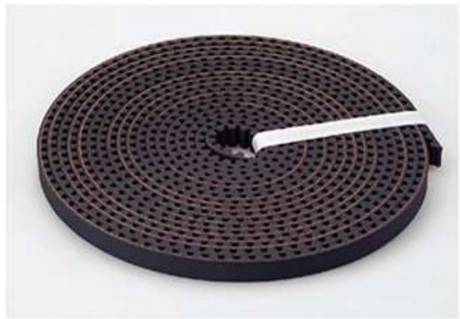
◀ تسمه ابریشمی