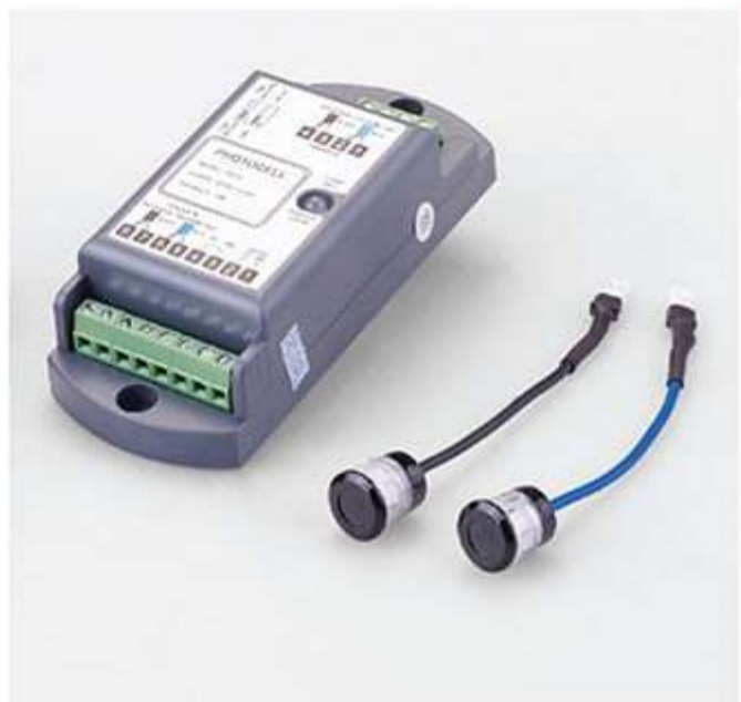
◀ سنسور خطی