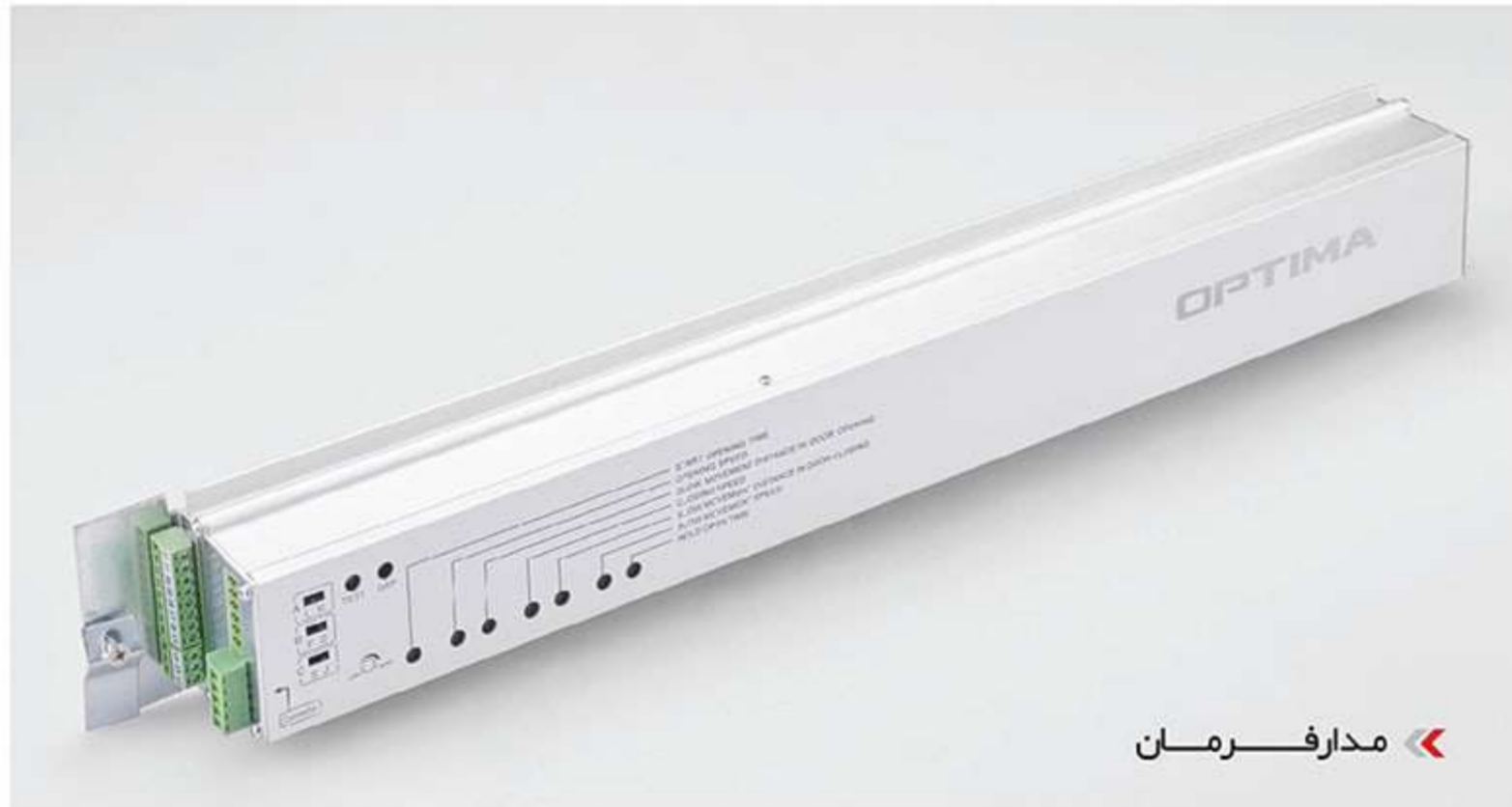
◀ مدار فرمان