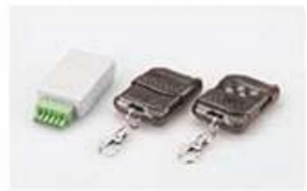
◀ ریموت تعیین وضعیت