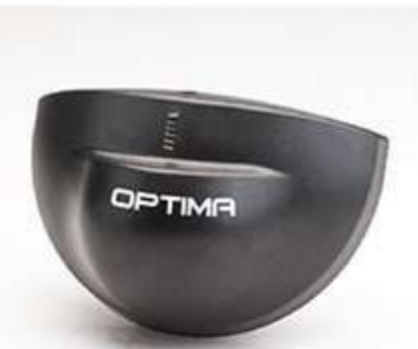
◀ سنسور BEA