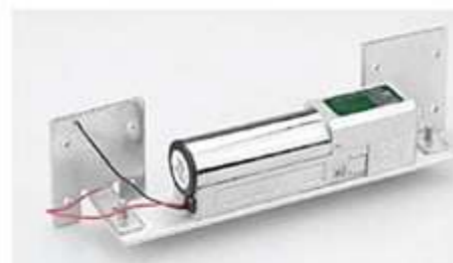
◀ قفل برقی (آپشنال)